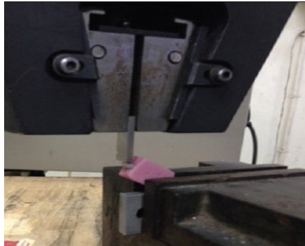
الشكل(4): تطبيق قوى الضغط على العينات

تعرضت كتلة الراتنج الاكريلية الحاملة للأسنان لقوة ضغط بزواوية 148 درجة وبسرعة 0.5 ملم/ دقيقة. قوة الضغط القصوى التي حدث عندها كسر السن تم قياسها بالنيوتن. تم تسجيل أي كسر يحصل على انه فشل في نظام الوند المتبع.