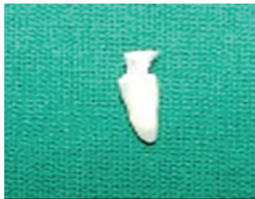
الشكل(1): السن بعد تطبيق RIBBOND

تم ذلك ال Ribbond في المساحة المحضرة له بحيث امتدت 2ملم خارج القناة وتم تصلبها لمدة 60 ثانية.