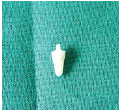
الشكل(3): السن بعد تطبيق FIBER POST