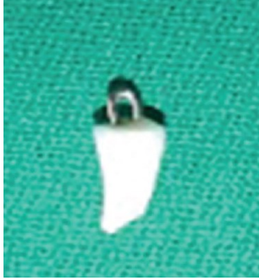
الشكل(2): السن بعد تطبيق OMEGA LOOP

الأقنية تم تخريشها و تطبيق العامل الرابط , تم ثني سلك تقويمي مقاوم للصدأ بطول 1.5 سم و قطر 0.7 ملم بإستخدام (مطواة 130) التقويمية لتشكل حلقة أوميغا / Omega loop . تم ملء مساحة الوتد المخصصة برانتج ثنائي التصلب وتم إدخال حلقة الأوميغا / Omega loop والتصليب لمدة 60 ثانية يتكون هذا السلك من نهاية ضمن جذرية ونهاية قاطعة، تم تشكيل النهاية ضمن جذرية باستخدام حامل إبر عن طريق ضغط طرفي السلك وإدخاله في الفراغ المخصص ضمن القناة، النهاية الجذرية تمتد تقريباً 3ملم داخل القناة الجذرية وذلك لزيادة الحماية الكلية للسلك. أما النهاية القاطعة فتبرز 2-3 ملم فوق القسم المتبقي حيث يؤمن هذا خواص ميكانيكية تدعم مادة الترميم النهائي.