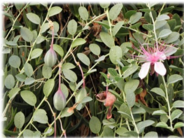
الشكل (1): نبات القبار

وأربع بتلات وعدد كبير من الأسدية البنفسجية الطويلة، بالإضافة إلى قلم واحد. ثمار النبات تكون شبه كروية إلى كمثرية، خضراء زيتونية، وتتميز بنكهة خفيفة [13][12][11].